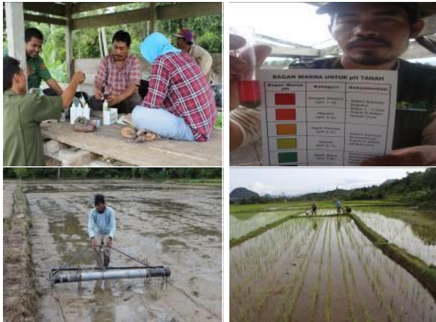
Gambar 7. a. Uji tanah sawah langsung di lapangan di Desa Pinamula; b. Tanam padi sawah sistem jajar legowo 2:1 di Desa Air Terang