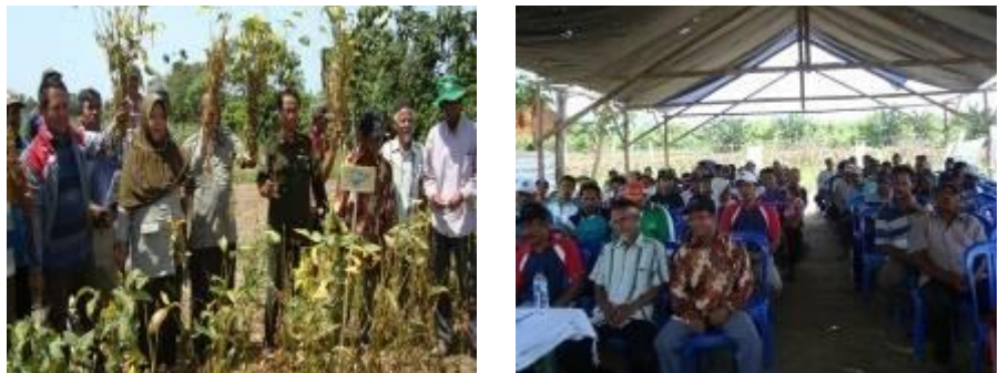
Gambar 4. Kegiatan Panen dan Temu Lapang di Demfarm Kedelai