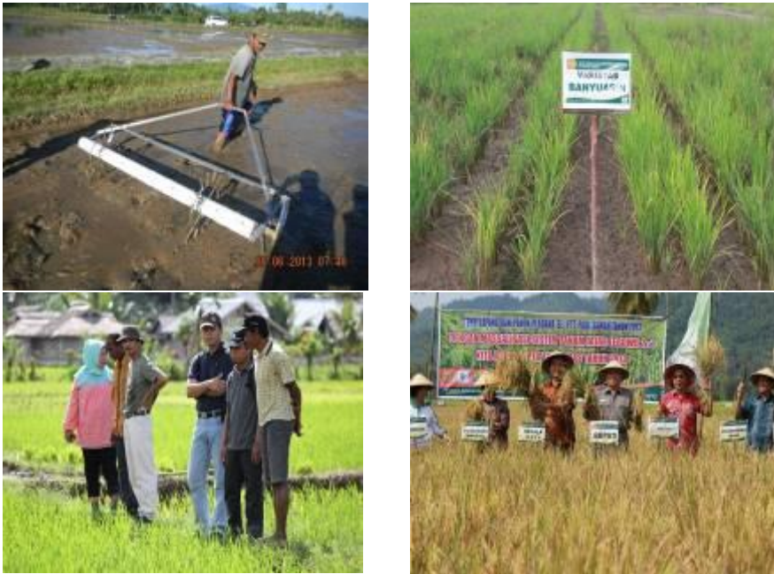
Gambar 5. a. SL penanaman dengan sistem tabela ; b. Keragaan VUB di Lokasi Display; c. Tim Monev BPTP Sulteng ke lokasi display di Kab. Buol; d. Panen perdana oleh Bupati Buol