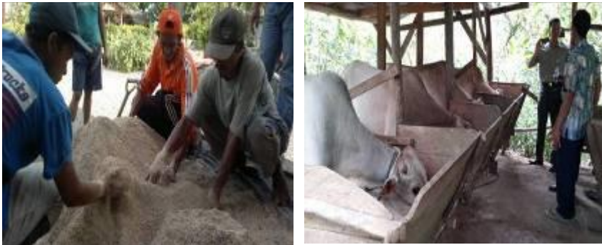
Gambar 2. Pembuatan pakan tambahan berbahan dasar KBK fermentasi dan Kunjungan Kepala BPTP Sulteng melihat sapi potong yang diberikan pakan tambahan berbahan KBK fermentasi