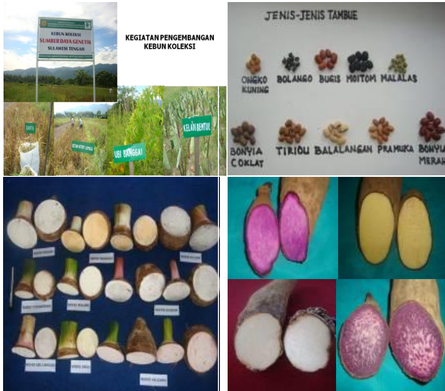
Gambar 3. Tampilan Beberapa Koleksi SDG Di Sulawesi Tengah