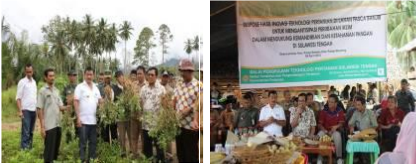
Gambar 1. Suasana Panen dan Diskusi di Lokasi Kajian BPTP Sulawesi Tengah pada Acara Ekspose Inovasi Teknologi dan Kebijakan Kegiatan Pengkajian Pengelolaan Air Pada Lahan Sub Optimal