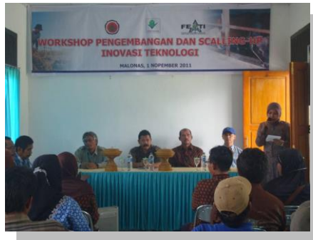
Lampiran 3b. Kegiatan Scaling Up FEATI