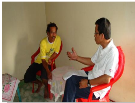
Lampiran 4c. Kegiatan PIPKPP (Kelembagaan Formal dan Informal