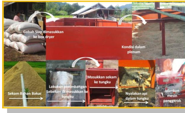
Lampiran 4a. Kegiatan Kompetitif Optimalisasi Alat Pengering Gabah