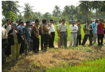
Lampiran 3a. Kegiatan Peningkatan KP Sidondo