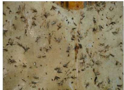
Lampiran 1b. Kegiatan Pendampingan Gernas kakao