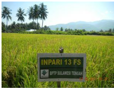
Lampiran 2c. Kegiatan Koordinasi Perbenihan dan UPBS di lapangan