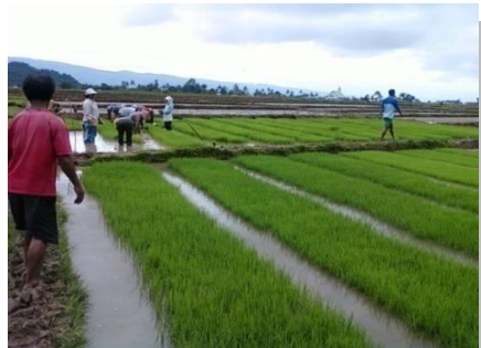
Lampiran 1a. Kegiatan Pendampingan SL-PTT Padi di lapangan