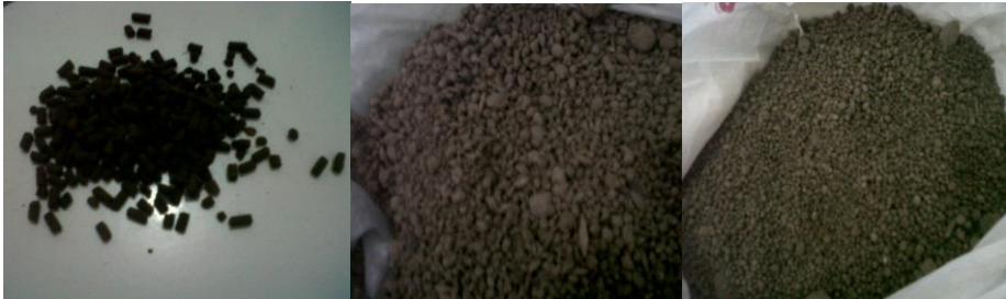
a. Pupuk organik Tablet b. Pupuk organik Granul Promi c. Pupuk Granul Perbaikan