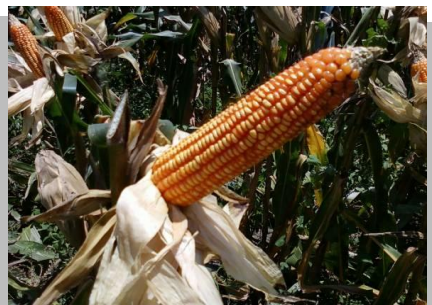
Lampiran 4b. Kegiatan PIPKPP (Pengembangan VUB Jagung Hibrida