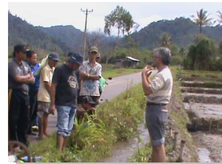
Lampiran 2b. Kegiatan M-P3MI di Kecamatan Palolo Kab. Sigi