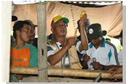
Lampiran 2a. Kegiatan Pendampingan PSDSK di Kab. Donggala