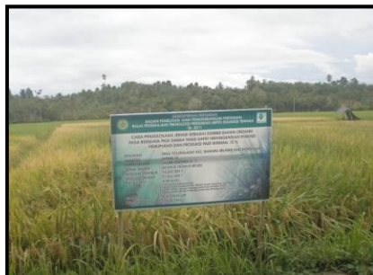
Lampiran 3c. Kegiatan Kompetitif Pengelolaan Jerami sebagai Bahan Organik Padi Sawah di Desa Tolongano Kec. Banawa Selatan